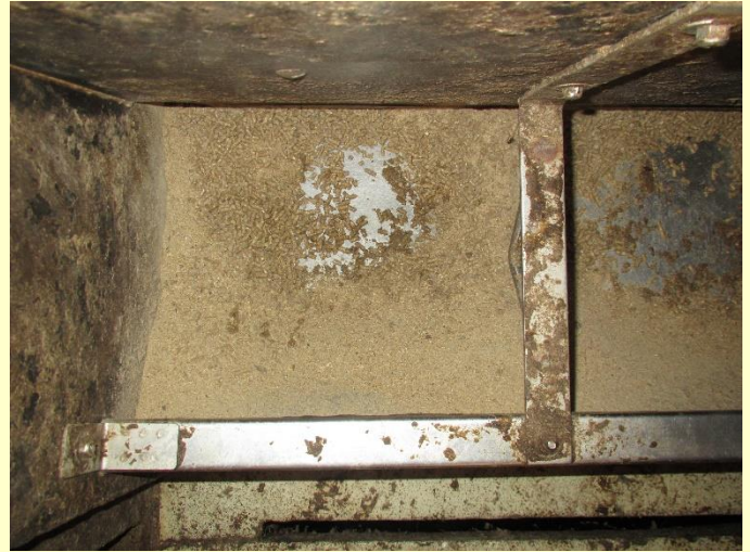
In de voederbak worden pellets gemakkelijk verbrijzeld tot meel en krijgen varkens de kans om selectief te zijn in hun opname