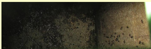
2 voorbeelden van voeder in de mestput