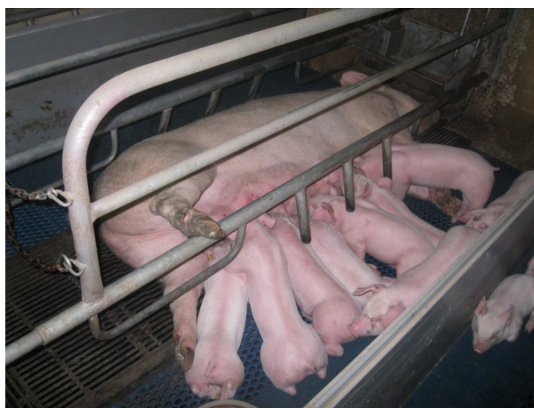
Figuur 3: Een zeug met haar biggen.

- Houd rekening met de bedrijfseigen situatie: vroeg spenen kan op een ander bedrijf geen problemen opleveren, maar op het eigen bedrijf mogelijk wel omwille van bedrijfseigen beïnvloedende factoren.