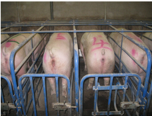
Figuur 1: De speenleeftijd en bijgevolg lactatieduur oefenen een invloed uit op het interval tussen spenen en dekken.

Voor de varkenshouder is het economisch interessant om het interval spenen - dekken (insemineren) zo kort mogelijk te houden. Hoe sneller de zeug opnieuw kan worden gedekt, hoe meer worpen ze kan voortbrengen. Onderzoek naar het verband tussen drachtpercentage en het spenen - dekken interval (SDI) heeft aangetoond dat als dit interval tussen 0 en 6 dagen ligt, er sprake is van een hoger drachtpercentage en een hogere worpgrootte dan als dit interval tussen 7 en 12 dagen ligt. Men spreekt hier dan ook over een hoog- en laagproductieve periode. Het blijkt dus beter te zijn voor de productieresultaten dat het SDI zich tussen 0 en 6 dagen bevindt. Daarnaast werd aangetoond dat zeugen die vroeg worden gespeend (14 dagen), een verhoogd risico lopen om pas tussen 7 en 12 dagen na het spenen worden gedekt (en dus in de laagproductieve periode), ten opzichte van zeugen die later worden gespeend (19 dagen). Te vroeg spenen kan er dus toe leiden dat de zeug in de laagproductieve periode wordt gedekt, waardoor de kans groter wordt dat ze niet meteen drachtig zal zijn.