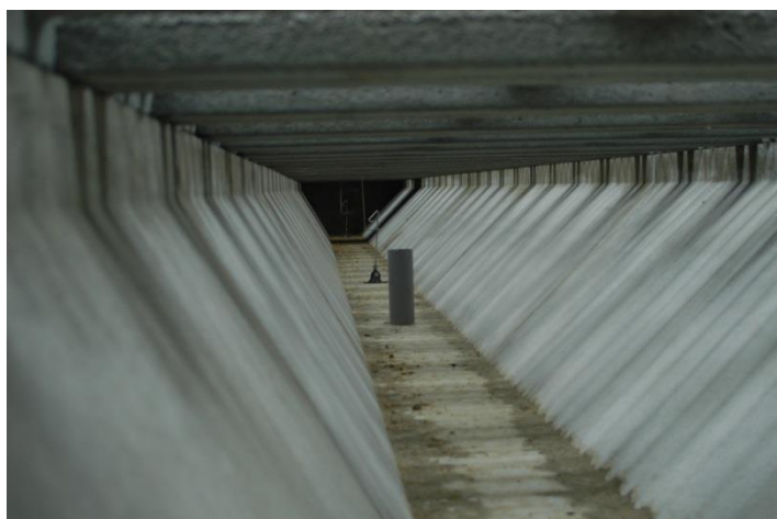
Foto 1 Bij de aanleg van het mestkanaal moet erop worden gelet dat de afsluiters de aflaatopening goed afsluiten en dat de schuine wanden glad en niet-mestaanhechtend zijn. Er wordt in principe afgelaten vóór het mestniveau de overloop bereikt.

De afsluiters moeten in staat zijn de opening goed af te sluiten. Dit moet bij de aanleg worden gecontroleerd op vloeistofdichtheid. Als de openingen in het mestkanaal niet goed of niet volledig zijn afgesloten stroomt het dunne deel weg zodat de overblijvende mest dikker wordt en dus moeilijker is af te voeren. Als daarentegen de centrale afsluiter (in geopende toestand) niet goed van de lucht afsluit gaat vacuüm verloren waardoor het aflaten evenmin goed verloopt. Het materiaal moet bovendien