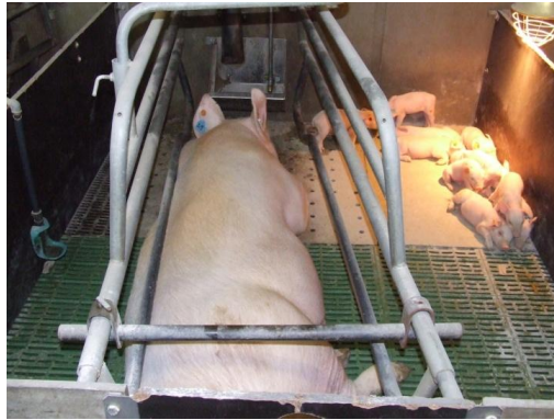
Foto 14. Commerciële poeders kunnen aangewend worden om de omgeving van de biggen droog te houden