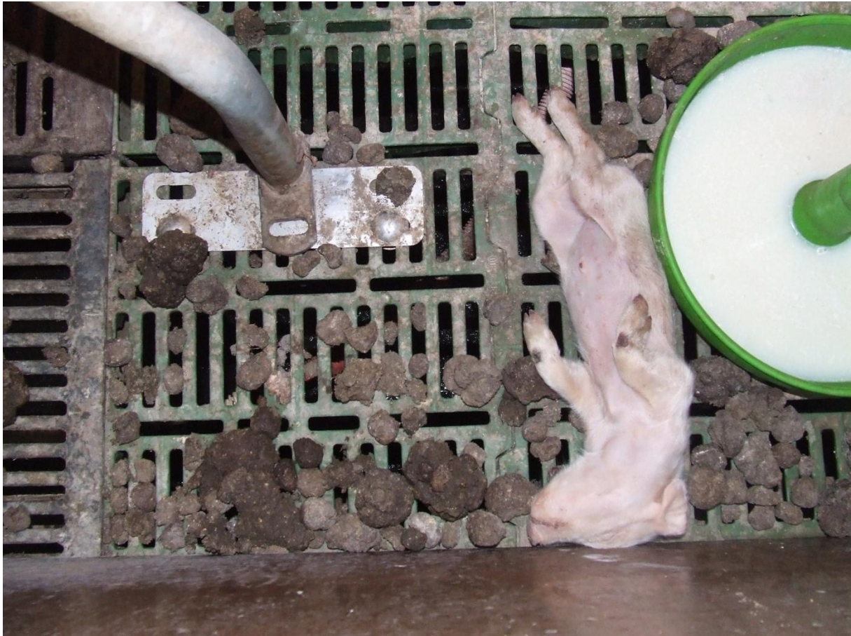
Foto 8. Harde mest kan leiden tot meer doodgeboorte

Naast drinkwater is het ook belangrijk dat de zeugen altijd een minimum aan voeder ter beschikking hebben. De voedergift te hard beperken de laatste dagen voor het werpen kan obstipatie in de hand werken omdat de darmen dan niet voldoende gestimuleerd worden. Het is aangewezen om altijd minstens 1,5 kg voeder te verstrekken aan de dieren. Het voeder dient ook voldoende vezel te bevatten. Een speciaal werpvoeder bevat extra vezels en kan ingezet worden bij problemen met obstipatie. Lactatievoeder bevat veel minder vezels dan drachtvoeder of werpvoeder, hiermee starten voor de partus kan obstipatie veroorzaken.