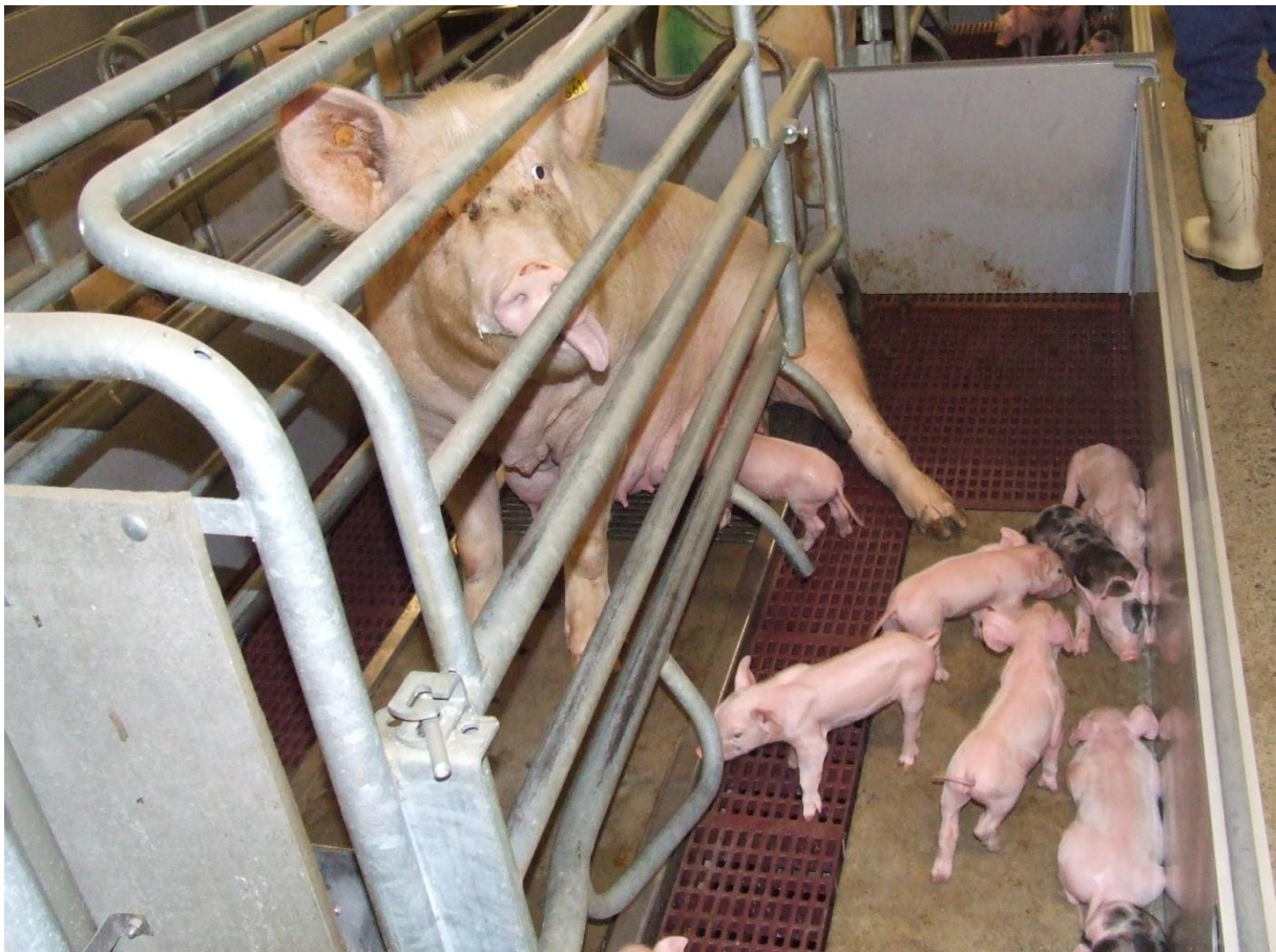
Foto 9. Vermijd dat de zeugen bij het toezicht houden telkens opschrikken

Tot slot is het ten sterkste aangewezen om altijd rustig te werk te gaan in de kraamstal. Zowel bij de controle tijdens het werpen als tijdens het manueel opvoelen van de zeug is rust een absolute vereiste. Kwaliteit en manier van toezicht houden hebben een grote invloed! De beste manier is om continu op een rustige manier in de kraamstal aanwezig te zijn, of helemaal niet. Nefast is om periodiek de zeugen te laten schrikken.