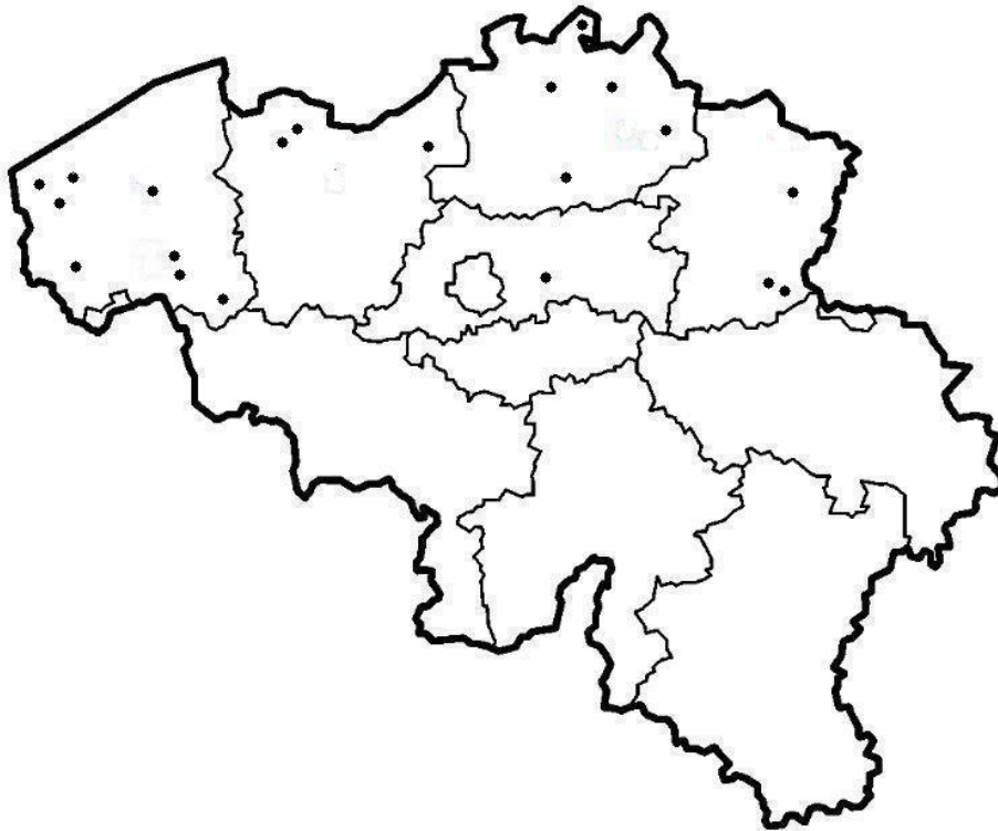
Foto 1. Geografische spreiding van de deelnemende bedrijven

Vijftien bedrijven die kampten met een te hoge uitval in de kraamstal werden gedurende een periode van 2 jaar opgevolgd. Het percentage doodgeboren biggen en uitval bij de zeug samen varieerde op deze bedrijven van 23% tot 30%. De opvolging van de bedrijven gebeurde aan de hand van 3 bedrijfsbezoeken en gericht onderzoek. Bij het eerste bezoek werd een analyse van het bedrijf gemaakt met behulp van een uitgebreide checklist en een bedrijfsrondgang. Hierbij werden de mogelijke oorzaken voor een verhoogde uitval in beeld gebracht. Ook werden er doodgeboren en gestorven biggen onderzocht op autopsie om infectieuze oorzaken uit te sluiten. Op basis van alle verzamelde gegevens werden tijdens het tweede bedrijfsbezoek gerichte adviezen gegeven om de uitval te reduceren. Tijdens het laatste bezoek werden de uitgevoerde adviezen geëvalueerd. Bij elk bezoek werden de bedrijfsgegevens uit het managementprogramma opgevraagd zodat een opvolging van de kengetallen mogelijk was.