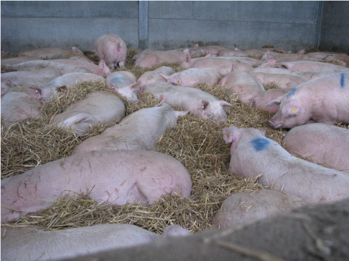
Foto 15. Breng de zeugen in een optimale conditie tijdens de dracht

millimeter spek afmageren tijdens de lactatieperiode. De conditie van de zeugen wordt vervolgens best terug op peil gebracht na het dekken.