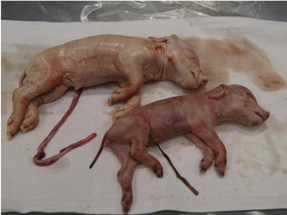
Foto 5. Boven een doodgeboren big met een lange en vochtige navelstreng. Onder een levend geboren, gestorven big met verkorte en opgedroogde navelstreng

Tot slot dient opgemerkt te worden dat doodgeboren biggen geen mummies zijn. Deze dienen apart genoteerd en ingegeven te worden.