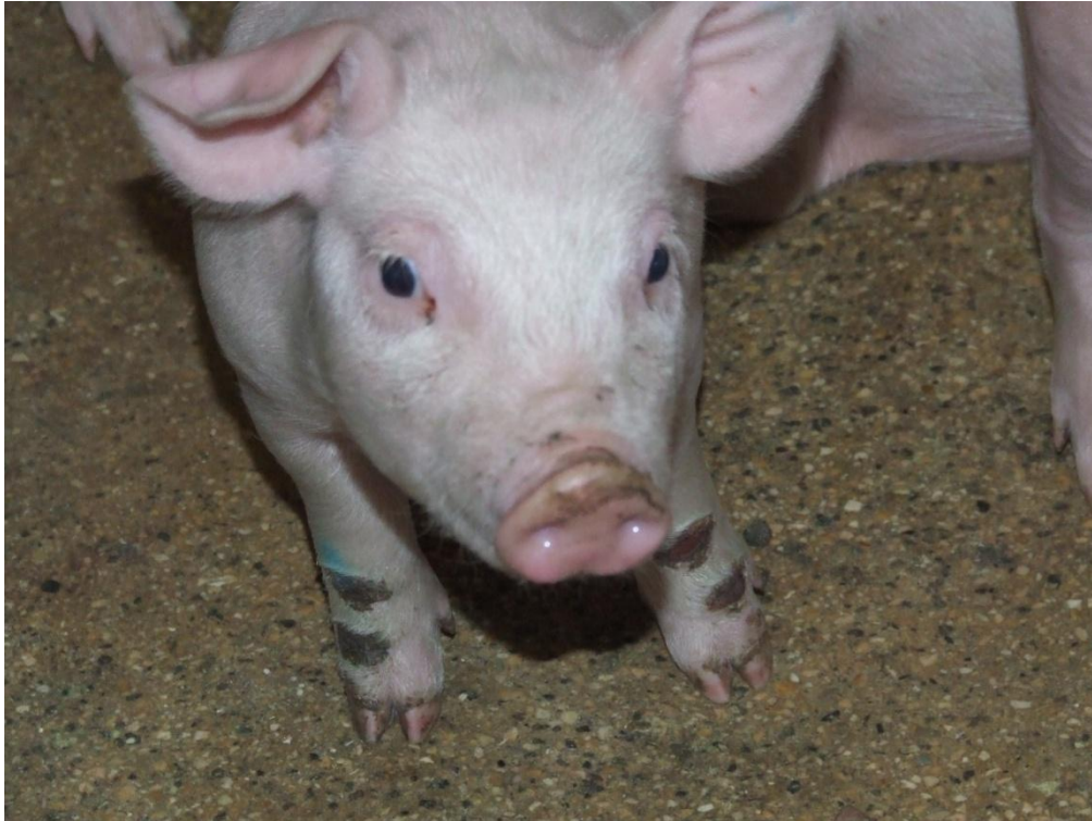
Foto 18. Wondjes veroorzaakt door een ruwe vloer kunnen een intredepoot zijn voor streptokokken

De vloer van de kraamhokken is eveneens belangrijk. Een te ruwe vloer kan aanleiding geven tot kleine wondjes aan de gewrichten van de biggen. Deze kunnen dienen als intredepoot voor streptokokken. Wanneer de vloer van de kraamstal te ruw blijkt, kan overwogen worden om deze te coaten zodat de grove structuur verdwijnt. Vermijd ook scherpe randen en uitsteeksels als bron van wondjes. Anderzijds is ook een te gladde vloer nefast voor de biggen. Voorzie matten in de kraamstal wanneer u merkt dat de vloer niet voldoende grip geeft aan de biggen.