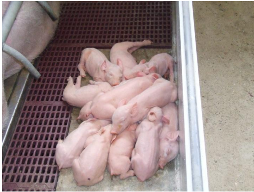
Foto 12 en 13. In een te koud biggenest kruipen de biggen op elkaar. Dit kan omdat de biggenlampen te hoog hangen