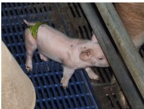
Foto 6 en 7. Het te vroeg inleiden van de geboorte geeft risico op zwakke biggen en zwemmers

Ongeveer een derde van de Vlaamse zeugenhouders brengt vandaag de dag het geboorteprocés van de zeugen op gang. De belangrijkste redenen voor het toepassen van partusinductie zijn het bekomen van meer toezicht tijdens het geboorteprocés en een mindere spreiding van de geboortes. Toch zijn er niet enkel voordelen verbonden aan het kunstmatig in gang zetten van de geboorte. Het te vroeg inleiden van de geboorte kan aanleiding geven tot meer doodgeboortes, meer zwakke biggen en meer zwemmers, waardoor de uitval in de kraamstal kan toenemen.