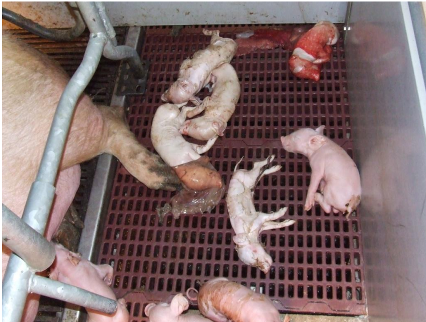
Foto 1. Een onderscheid maken tussen doodgeboorte en biggensterfte is belangrijk

Vanaf wanneer moeten we de uitval van biggen op het bedrijf beschouwen als problematisch? Een percentage doodgeboorte lager dan 8% wordt als normaal beschouwd. Voor biggensterfte is de bepaling van de norm moeilijker. Grenswaarden van 12% en 15% worden genoemd. Het percentage doodgeboorte en biggensterfte samen zou maximaal 19% mogen bedragen. Het is evenwel zo dat bedrijven met een hoog worp- en productiegetal relatief gezien een hoger percentage uitval zullen hebben zonder dat dit problematisch hoeft te zijn. Het verlies van 1 big op 5 tot aan het spenen wordt getolereerd. In de literatuur zijn een aantal oorzaken voor doodgeboorte en biggensterfte beschreven. Bepaalde factoren kunnen beide in de hand werken, andere factoren hebben specifiek een invloed op doodgeboortes of sterfte. Daarom is het belangrijk om het verschil te maken!