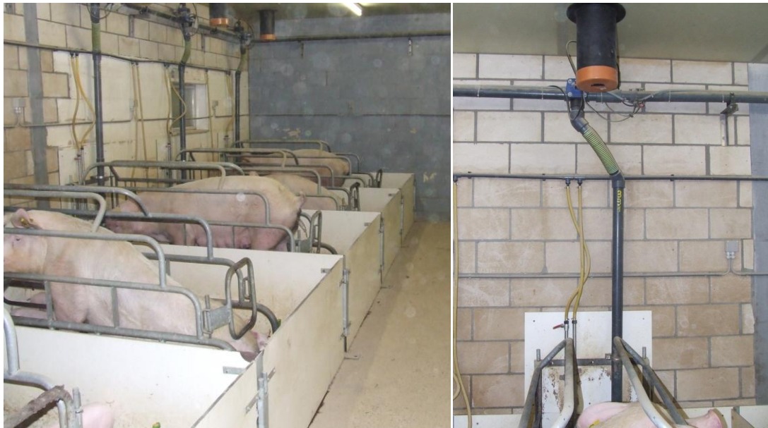
Tabel 3. Evolutie van de temperatuur in de kraamstal

Foto 10 en 11. Frisse neuzenventilatie kan helpen om de zeugen te voorzien van verse lucht