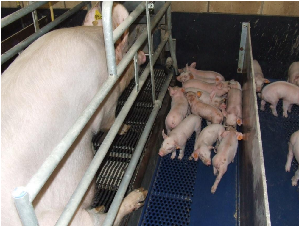
Foto17. Een zeugenbox aangepast aan de grootte van de zeug veroorzaakt minder stress